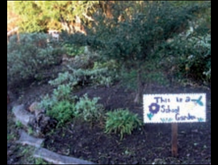
Orti urbani e giardini didattici.