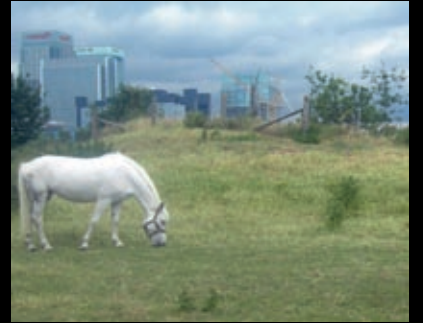
Città europee viste dagli orti: Lille (F), Bordeaux (F) e Londra (UK).